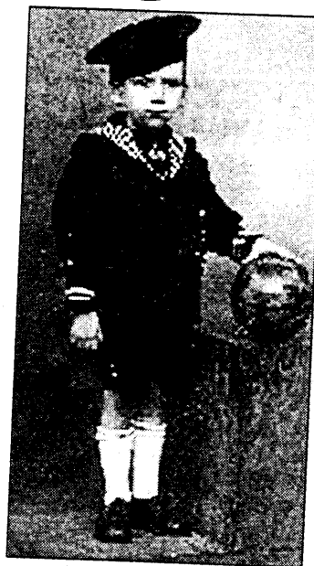
Weer samen na 56 jaar

In 1946 werd de kleine jongen geadopteerd door het gezin Van Gerwen in Buggenhout, waar hij de laatste maanden van de oorlog ondergedoken zat. De vijfjarige Jacky was wees geworden. Zijn moeder