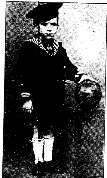
De foto's van Jacky Barkan die onze lezers op het spoor zetten.